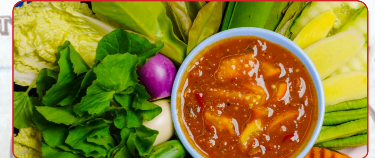
น้ำจืดใส่มะอึกเจ

Grilled tofu, southern red curry sauce, turmeric