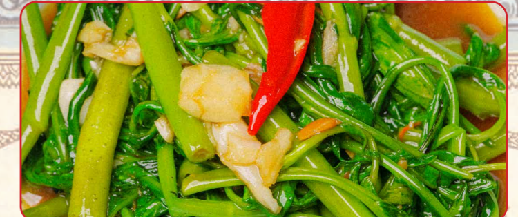
ผักบุ้งไฟแดง

Jungle herb fritters, sweet chilli and peanut dressing