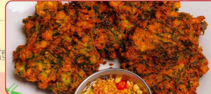
ทอดมันป่า

Relish with orange aubergine and seasonal vegetables