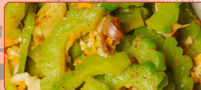
ผัดมะระใส่ไข่