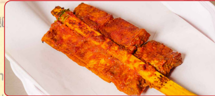
เต้าหู้ทอดและ

38 per person, available for a minimum of 2 guests.