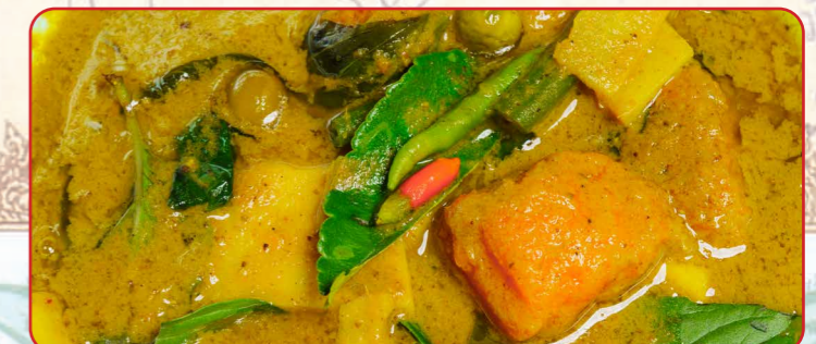
แกงเขียวผัก